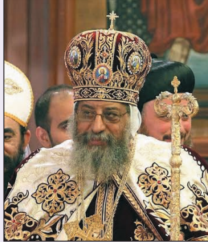
Pope Tawadros II

(118th and current Pope of Alexandria and Patriarch of the See of St. Mark)